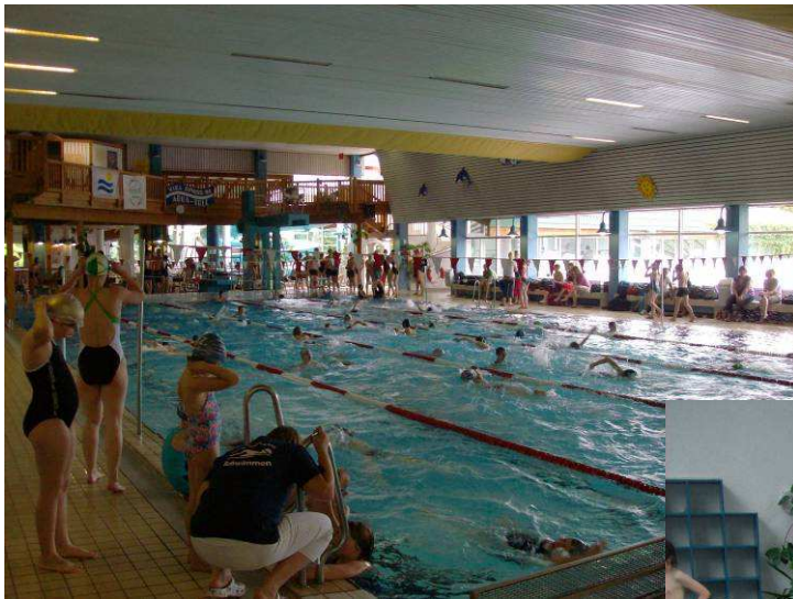
Volles Haus, bereits beim Einschwimmen. (links)

Nachstehend einige Fotos rund um den Wettkampf: